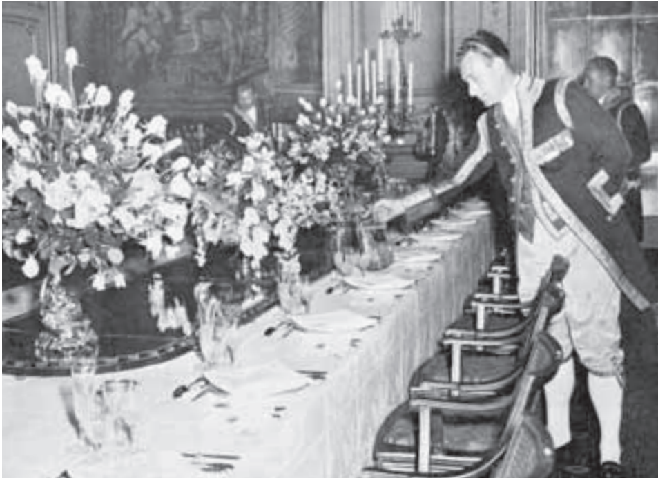
Cor maakte deel uit van de hofhuishouding. In die functie was hij mede verantwoordelijk voor de aankleding van banketten.

aan zijn ambachtschooltijd waar hij dat vak geleerd had. Vooral de lessen in esthetische vorming, die door mijnheer Knaap werden gegeven, hadden grote indruk op hem gemaakt. De manier waarop die man bijvoorbeeld uiterst elegant een sigaar opstak, vond hij een beleving. Misschien begon hier zijn gevoel voor stijl.