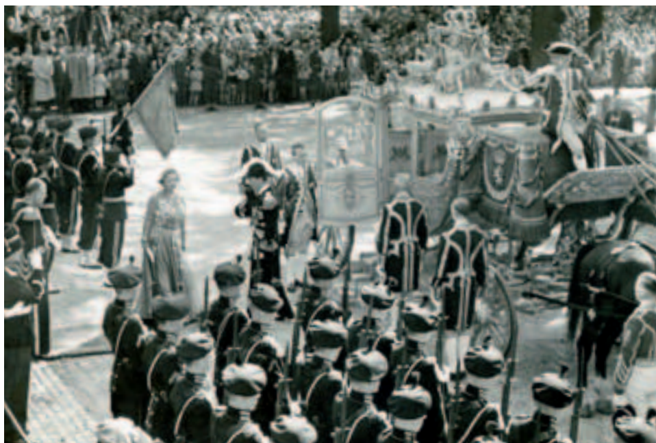
Cor opent de deur van de gouden koets bij de traditionele tocht door Den Haag op prinsjesdag.