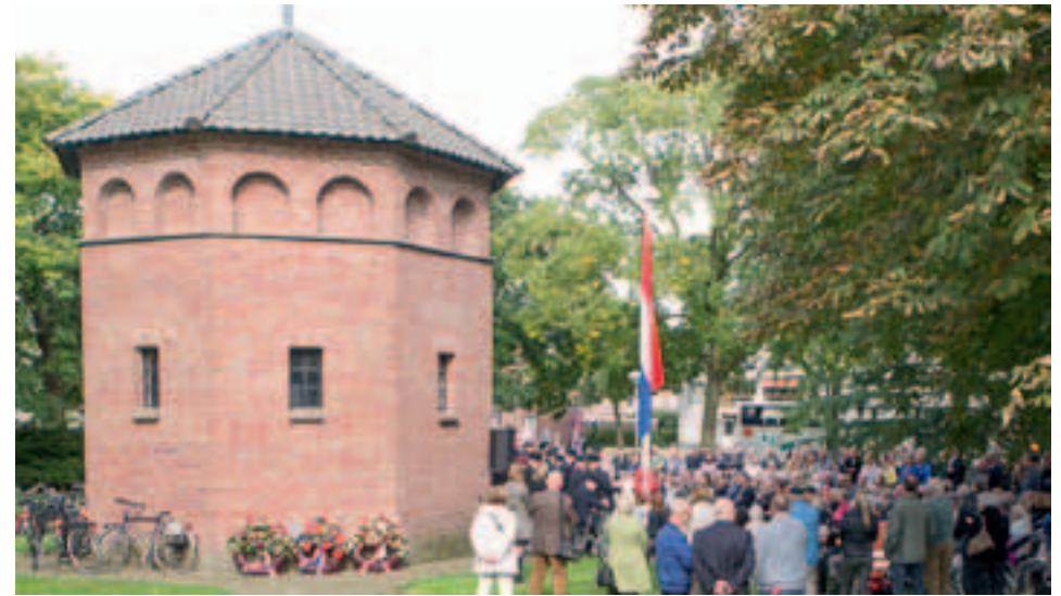
De Gedachteniskapel St. Jozef in het Hortensiapark vormt elk jaar het stemmige decor voor de Dodenherdenking.

Die tentoonstelling gaf een overzicht van de belangrijkste gebouwen die in de periode 1945 tot 1970 werden gebouwd en die in hun bewuste keuze voor baksteen en voor wat betreft de opvattingen van de Bossche School kenmerkend waren voor het bouwen in Brabant. Gebouwen die aan dat bouwen in Brabant een eigen karakter gaven. Op deze tentoonstelling werd uitvoerig melding gemaakt van de achtergrond van het St. Jozef kapelletje in Helmond. Hier werd duidelijk gemaakt dat Helmond de eer had om een vroeg ijkpunt te bezitten in een regionale architectuurontwikkeling. En dat vroege ijkpunt was het kapelletje, ontworpen door de grondleggers van de Bossche School zelf. Het is dan ook buitengewoon jammer dat dit kapelletje, dat een belangrijk