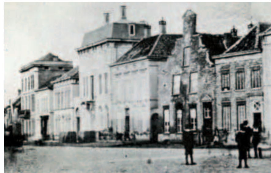
De oostelijke wand van de Markt aan het eind van de negentiende eeuw. In het pand met het opvallende torentje was het Witte Paard gevestigd. Het huis werd in 1668 gebouwd en kort na het maken van deze opname afgebroken.