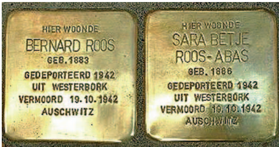
Twee voorbeelden van struikelstenen, het formaat is \pm 10 \times 10 cm (foto wikipedia)

Met struikelstenen worden kubusvormige betonnen stenen met een messing bovenlaag bedoeld, waarin een herinneringstekst is aangebracht. De stenen worden verankerd in het trottoir voor de huizen waaruit Joden zijn verdreven en vermoord. Een wandeling door zo'n straat kan zo veranderen in een reis door de geschiedenis. In Duitsland, Hongarije en Oostenrijk zijn al duizenden struikelstenen geplaatst en ook in Nederland zijn er steeds meer te vinden.