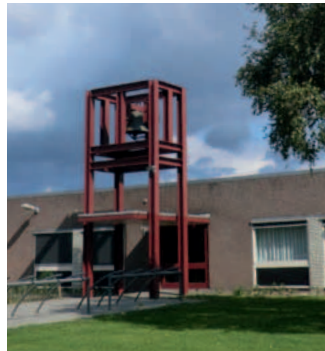
Het klokkentorentje van De Goede Herder. De kerk werd als noodkerk gebouwd, maar eind jaren zestig als parochiekerk in gebruik genomen.

niet haalbaar, daarom wordt in het park een nieuwe staalconstructie gebouwd. De klok migreert naar het nieuwe maaksel dat wordt uitgevoerd met een modern hamermechanisme, zodat hij onder andere bij Dodenherdenkingen kan luiden.