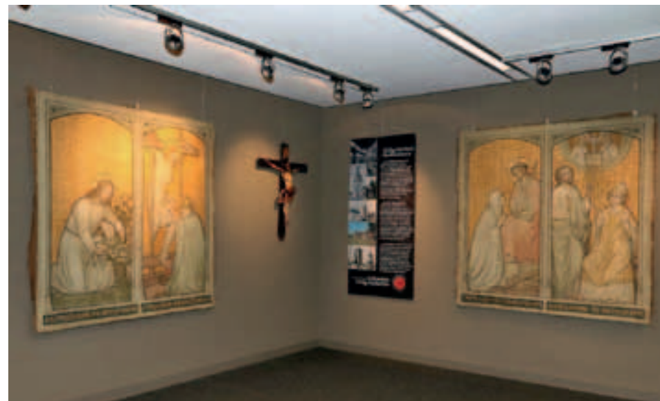
Impressie van de tentoonstelling in de bibliotheek Helmond-Peel.

De onderhavige schilderijen, die in opdracht voor de kerk in de Veestraat waren vervaardigd, werden lange tijd als verloren beschouwd. Na de ontmanteling van de kruisbasiliek in 1957, werden ze opgeborgen in een kelder. Onlangs werden ze teruggevonden en gerestaureerd. De hernieuwde aandacht zal niet voor kort zijn. De doeken krijgen een nieuwe bestemming in één van de Helmondse kerken.