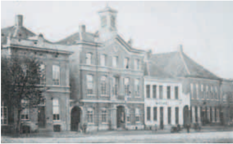
Foto van het voormalige stadhuis op de Markt gemaakt rond 1870. Rechts van het stadhuis bevindt zich hotel van Oppen, vanaf 1863 hotel Tielen geheten.

van de weduwe de nagt doorbragt, 't geen aenleijding gaf tot gansch nadeelige ergernis en groote verdenkingen'. De predikant had beiden daarover aangesproken en hen 'vrindelijk vermaandt van die nagtverkeering af te sien'. Toch bleven beiden in hun aanstotelijke gedrag volharden. De kerkenraad zag geen andere weg dan de 'delinquenten' nogmaals te vermanen en hun ernstig te verzoeken dit 'opspakelijk sondige nagtverblijf' te staken.